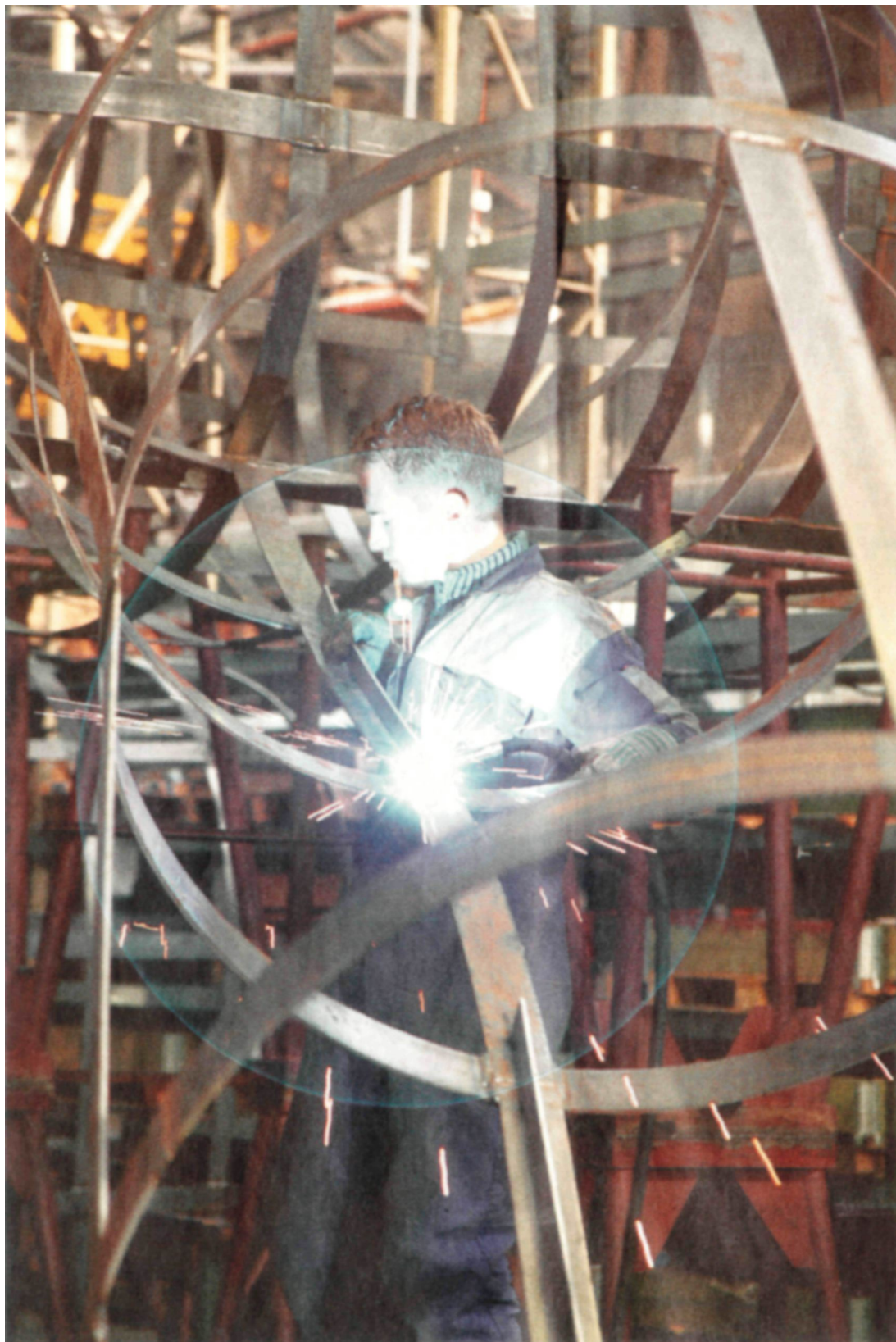
Een leerling-lasser aan het werk. De kans op werkloosheid na de opleiding is vrijwel nihil

Cijfers heeft Jacobi volop, met uitsplitsingen ook naar regio's en